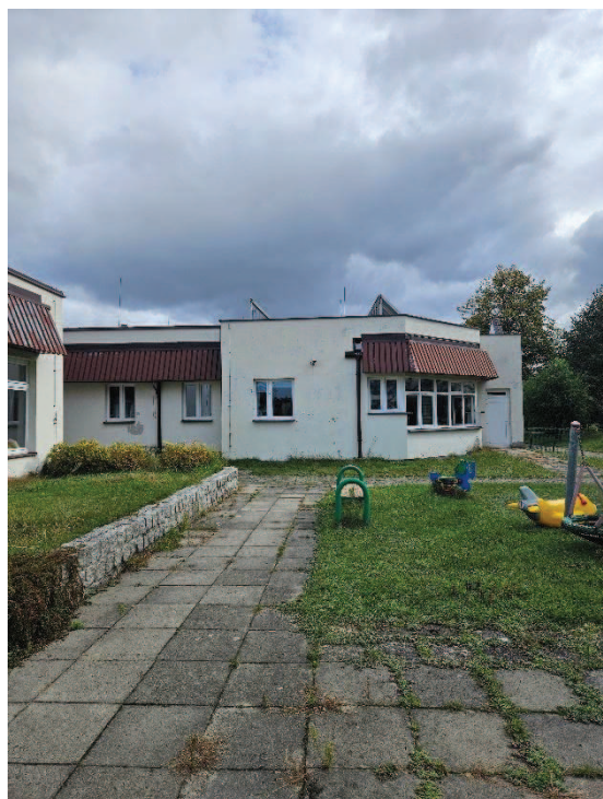
Fot. 3 – Fragment elewacji południowej- zachodniej- - widoczne łamcze światła, które będą demontowane