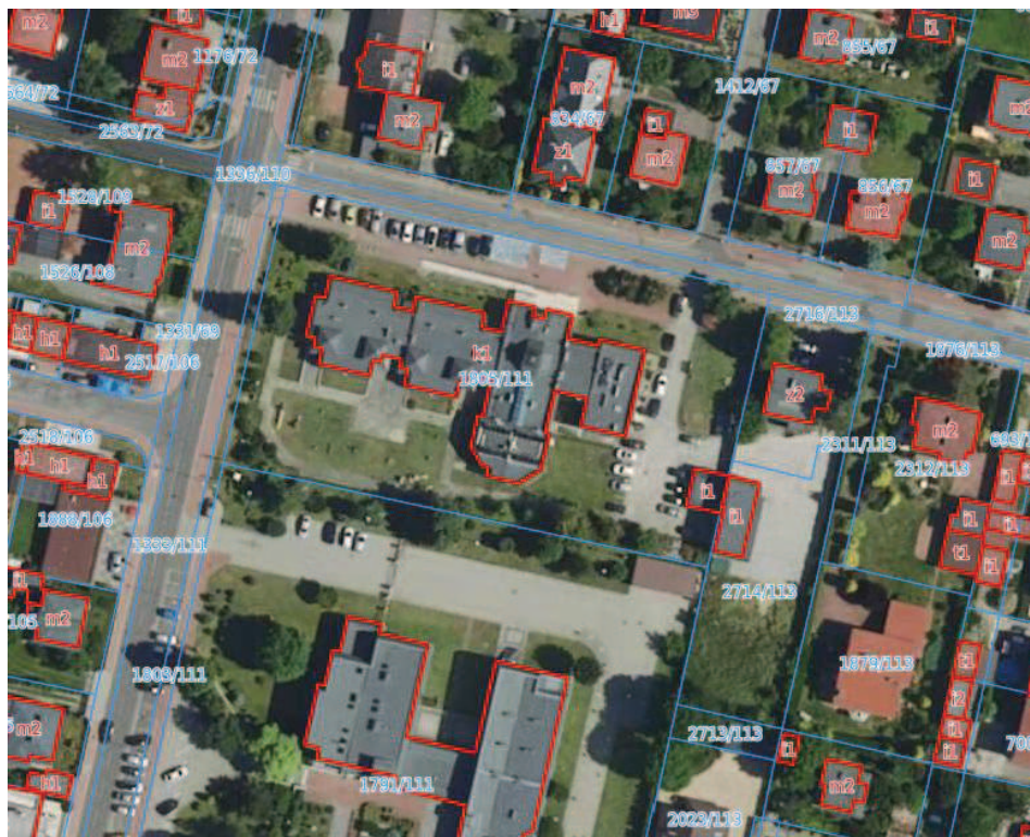
Fot.1 Zdjęcie satelitarne obrazujące budynek ośrodka z wysokości.

JEDNOSTKA EWIDENCYJNA: 247301_1.0089.AR_7.1805/111