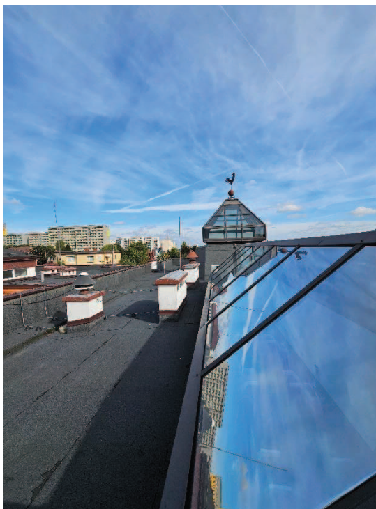
Fot. 4 Widok dachu z charakterystycznym świetlikiem znajdującym się nad wejściem głównym