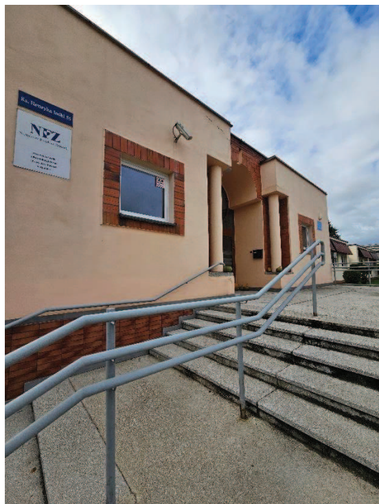
Fot. 1 – Wejście główne do budynku – planowany remont nawierzchni schodów i spocznika