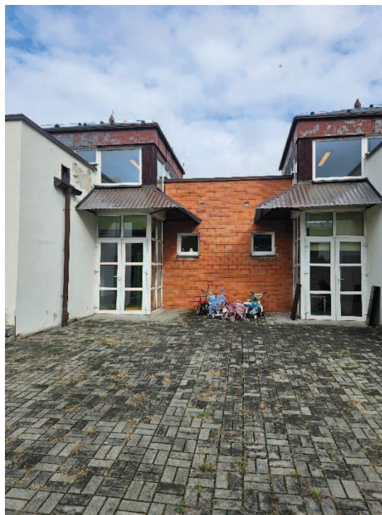
Fot. 2 – Fragment elewacji południowej – widoczne zadaszenie do remontu